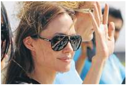
Solidarisch mit Flüchtlingen: UN-Ehrenbotschafterin Jolie