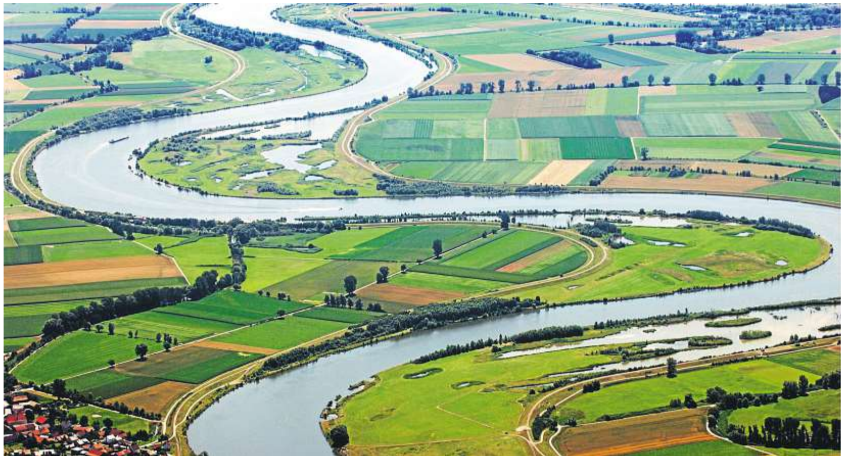
Einer der schönsten Abschnitte der Donau: Als geschlungenes Band windet sich der Fluss bei Pondorf (Landkreis Staubing-Bogen).

BERLIN. Teils deutlich gedämpfte Ausgaben und konjunkturbedingt sprudelnde Einnahmen haben den rund 150 Krankenkassen im ersten Quartal ein Milliardenplus beschert. Der Überschuss betrug rund 1,5 Milliarden Euro bei Ausgaben von gut 44 Milliarden, wie das Bundesgesundheitsministerium am Freitag in Berlin mitteilte. Schon vorher hieß es im Ressort von Minister Daniel Bahr (FDP), Beitragssenkungen seien nicht geplant. (dpa)