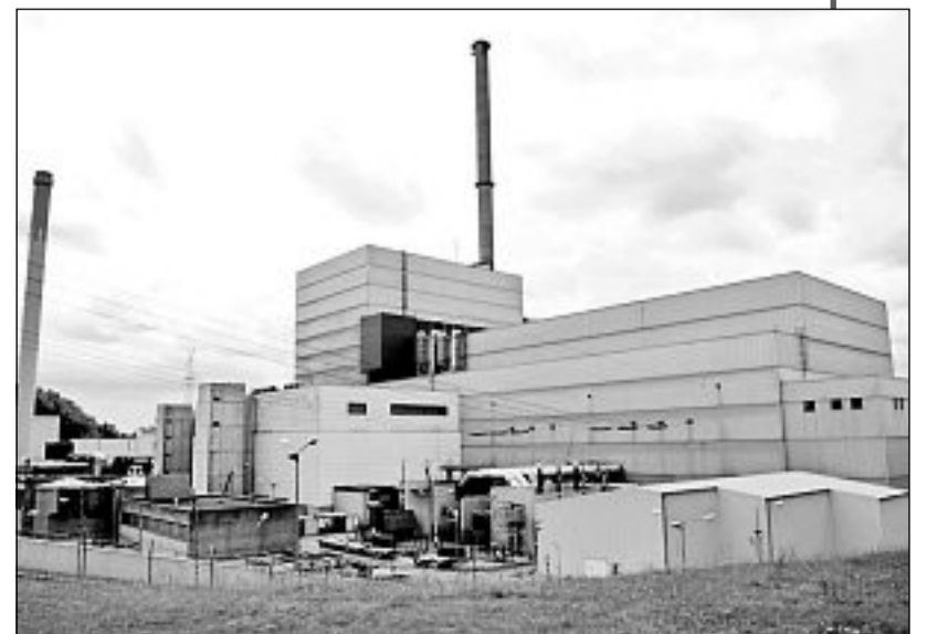
UNGEWISS: Die Zukunft des umstrittenen AKW Krümmel in Geesthacht ist weiter unklar.

Noch unklar ist die Zukunft der Brennelementesteuer. Teile der Union hatten das Aus erwogen, damit die Atomkonzerne mehr Geld in erneuerbare Energien investieren können. FDP-Chef Philipp Rösler will die Steuer dagegen behalten.