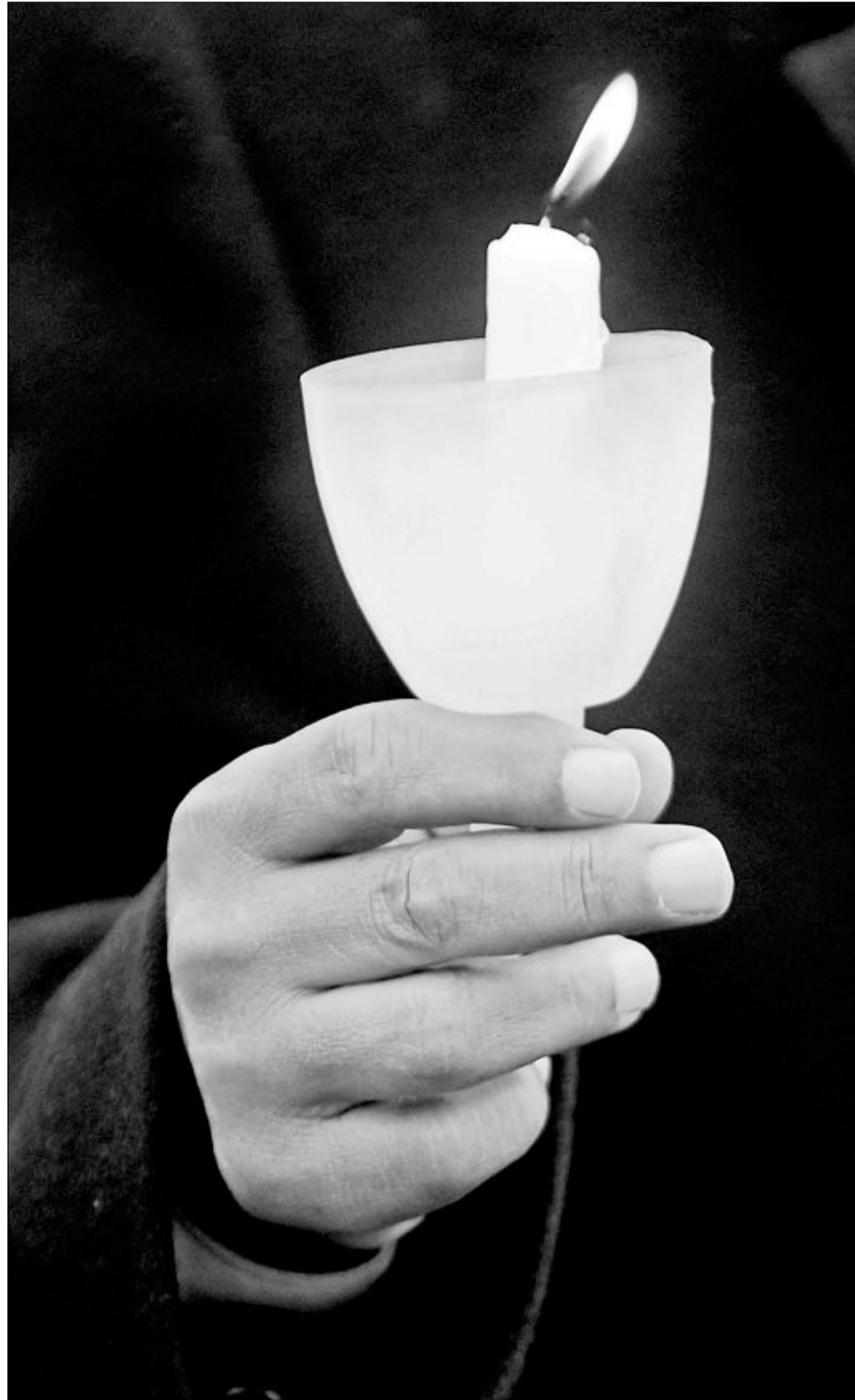
EIN LICHT GIBT HOFFUNG: Amnesty unterstützt auch die friedlichen Revolutionen in arabischen Ländern und mahnt dort an, die Menschenrechte zu achten.