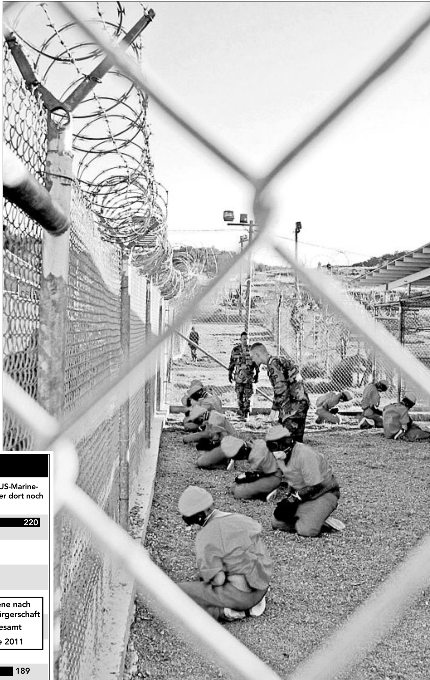
MENSCHEN HINTER STACHELDRAHT: Diese Bilder aus dem Gefangenelager Guantánamo schockierten die Welt – heute interessieren sich nicht mehr viele dafür.