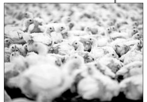
VIELE HÄHNCHEN, VIELE ANTIBIOTIKA: Artgerecht ist anders, sagen Tierschützer.

Bauernpräsident Gerd Sonnleitner verwies allerdings darauf, dass der Antibiotika-Einsatz in der Landwirtschaft bei steigender Produktion gesunken sei. Kranke Tiere müssten aber therapiert werden: „Alles andere wäre Tierquälerei.“