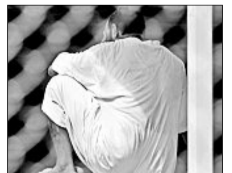
OHNE PERSPEKTIVE: Die meisten Gefangenen kommen gar nicht erst vor einen Richter.